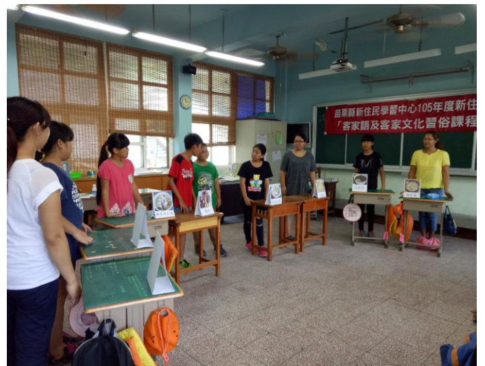
說明：打嘴鼓練習～親子共學