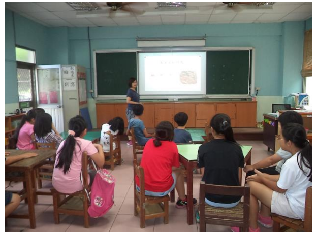
說明：介紹常見的(炆和炒)的客家名菜