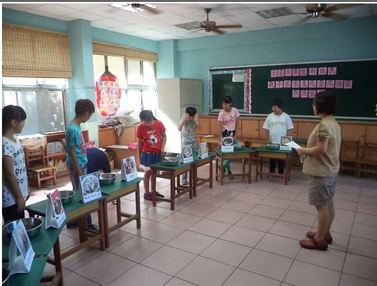
說明：打嘴鼓練習～辦桌