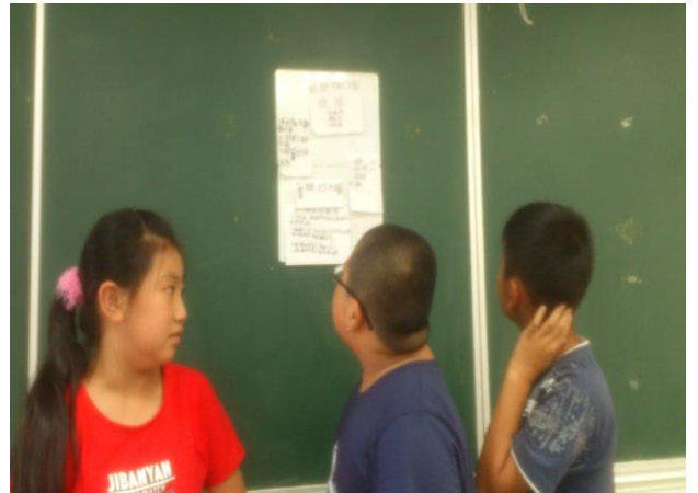
說明：分組討論後發表