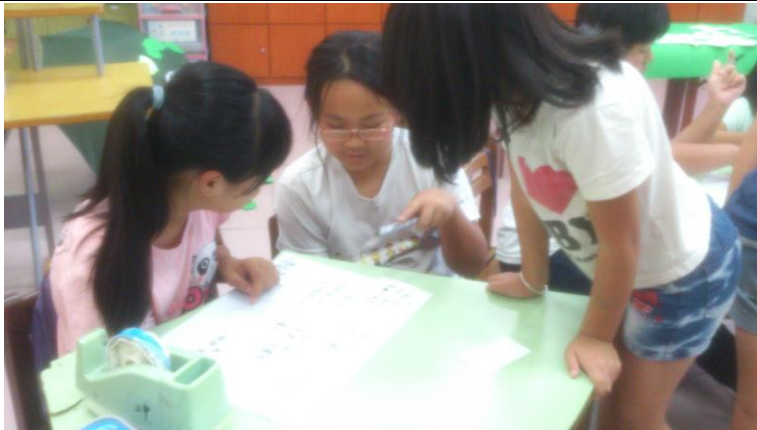
說明：分組討論(寫劇本)